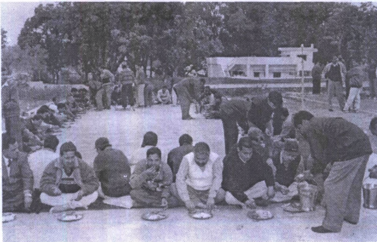
भारतीय प्रतिरक्षा मजदूर संघ के संयुक्त वार्षिक अधिवेशन के उपरान्त सहभोज का दृश्य