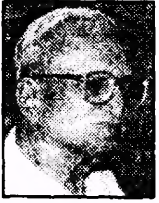
मा. श्रीदत्तोपंत वेगडी