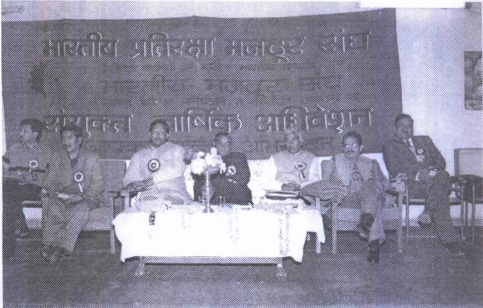
भारतीय प्रतिरक्षा मजदूर संघ का संयुक्त वार्षिक अधिवेशन रायपुर, देहरादून में सम्पन्न