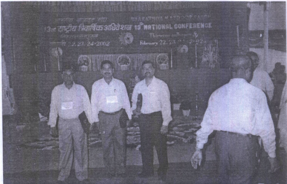
भारतीय मजदूर संघ के 13वें राष्ट्रीय अधिवेशन, तिरुवनन्तपुरम (22, 23, 24 फरवरी, 2002) में उत्तरांचल प्रदेश के प्रतिनिधि