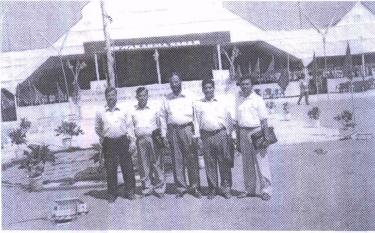
तिरुवनन्तपुरम के राष्ट्रीय अधिवेशन स्थल का दृश्य